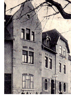
Dt. Post ab 1932

Republik, 3. Reich, DDR und BRD bis 2001. In diesem Postgebäude entstand auch die Telefonzentrale für das Vieselbacher Netz (heute 036203). Während der DDR-Zeit war das Angebot der Deutschen Post umfangreich. Es gab Paket- und Postverkehr, Zeitungsvertrieb, Postsparkassendienst, Toto/Lotto und einiges mehr. Im Mai 2001 beendete das Postamt seinen Dienst und gleichzeitig