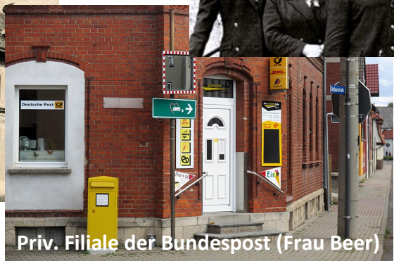
Priv. Filiale der Bundespost (Frau Beer)