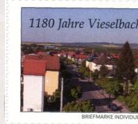
Zwei seltene Vieselbacher Marken