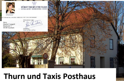
Thurn und Taxis Posthaus

Bis zum nächsten Rückblick Manfred Langguth.